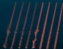
Baguettes (8 différentes)