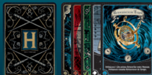
Cartes Récompense (5 types différents)