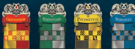
Tuiles Drapeau (4 types différents)