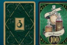
Carte Maître des Potions