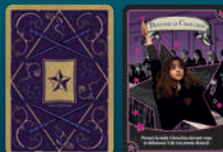
Carte Devenir le Choucou