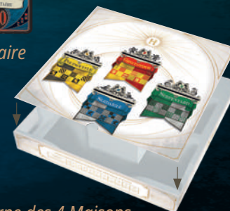
Urne des 4 Maisons