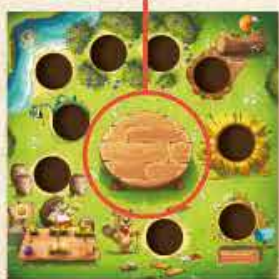
Table des récoltes