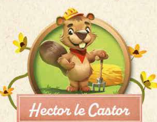
Hector le Castor

Choisis 1 type de ressource disponible sur la Table des récoltes (Miel, Baie mûre ou Paille) et fais glisser par la fente du plateau Prairie tous les jetons du type choisi jusqu'au plateau Terrier, sur les emplacements correspondants. Si tous les emplacements sont occupés, vous avez gagné la partie . Les ressources en trop sont inutiles. Attention, tu ne peux jamais stocker de Baies pourries.