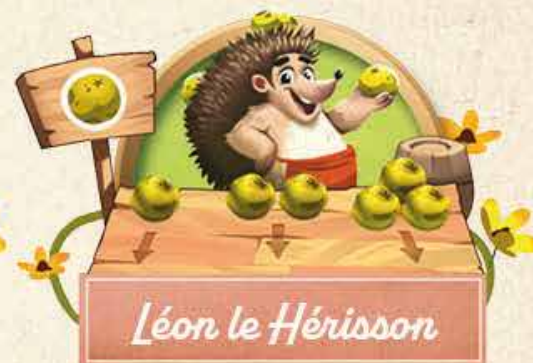
Léon le Hérisson

Tu peux dépenser 1 jeton Paille présent sur la Table des récoltes. Pioche alors 1 carte Castor, et place-la face visible à côté du plateau Terrier : tous les joueurs disposent maintenant de cette amélioration jusqu'à la fin de la partie (les effets des cartes Castor sont expliqués p. 6).