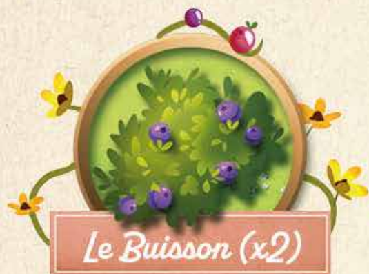
Le Buisson (x2)

Lorsque tu joues un Chien de prairie, déplace-le tête en bas dans un trou inoccupé du plateau (tu ne peux pas rester dans le même trou) et applique l'effet correspondant à l'illustration de ce trou :