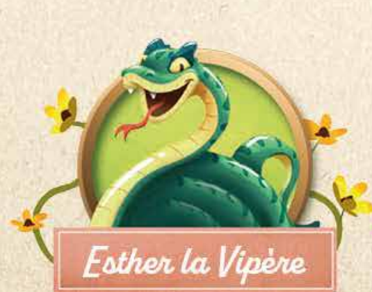
Esther la Vipère

Échange des Baies pourries de la Table des récoltes contre UNE ressource de Léon. Ainsi, pour 1 Baie pourrie, tu recevras 1 Baie mûre ; pour 2 Baies pourries, 1 Paille ; pour 3 Baies pourries, 1 Miel.